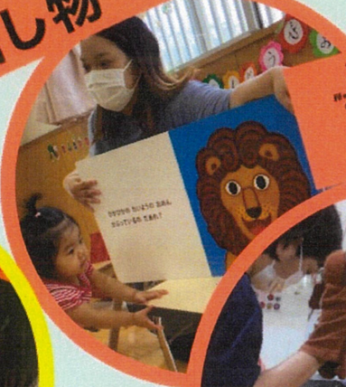
大型絵本 "おめんです" "はらぺこ あおむし"