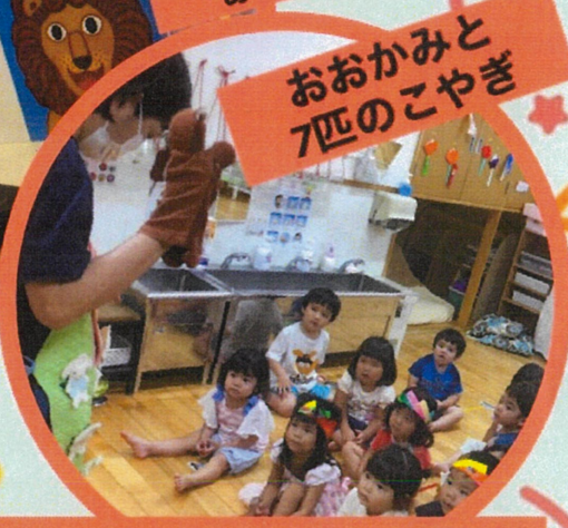
おおかみと 7匹のこやぎ