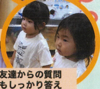
お友達からの質問 にもしっかり答え られるようになって います🎵