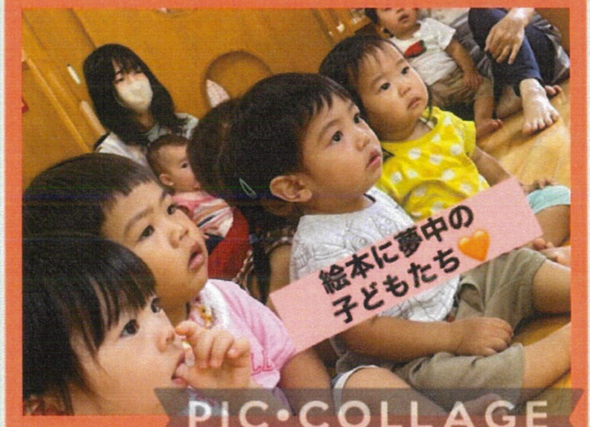
絵本に夢中の 子どもたち👧