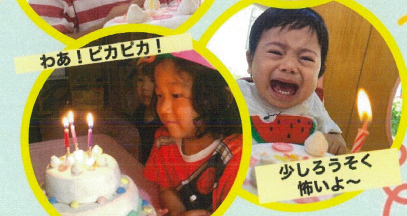
少しろうそく 怖いよ～