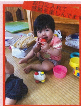
お口に入れて 感あを楽しんでます